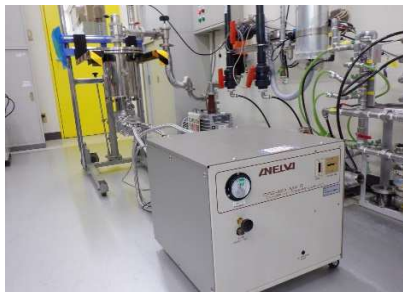
・コンプレッサーCRC-420MK II (O51206)