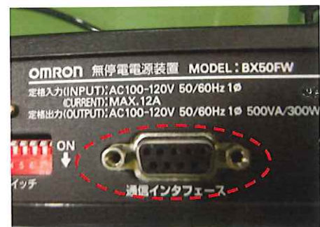
通信インターフェース