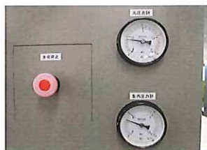
缶内圧力(アナログ表示)