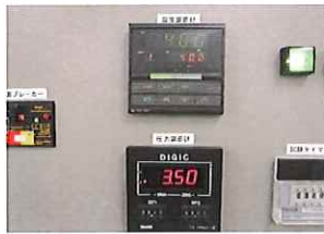
缶内圧力(デジタル表示)