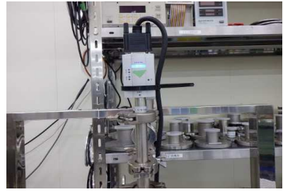
・測定子: ULVAC製 SW1(社内用)