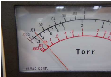
・GP-2A:: 1.0 × 10 -2 Torr