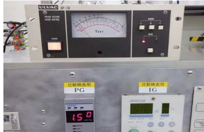
・ISG1(比較用): 1.5Pa (1.1 × 10 -2 Torr)