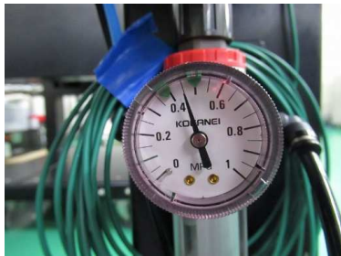
レギュレーター付属