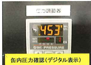
缶内圧力確認(デジタル表示)