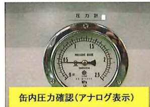
缶内圧力確認(アナログ表示)