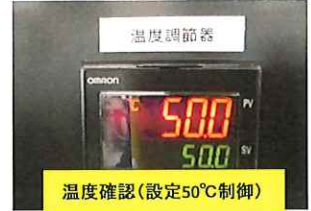
温度確認(設定50℃制御)