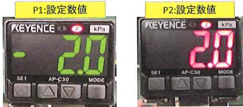
P1:負圧回路似て確認