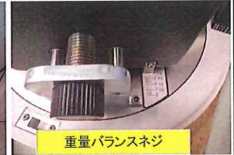
重量バランスネジ