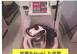
容器をセットした状態