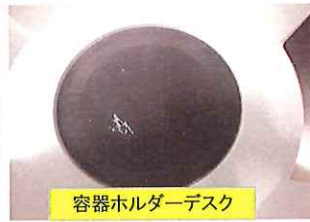
容器ホルダーデスク